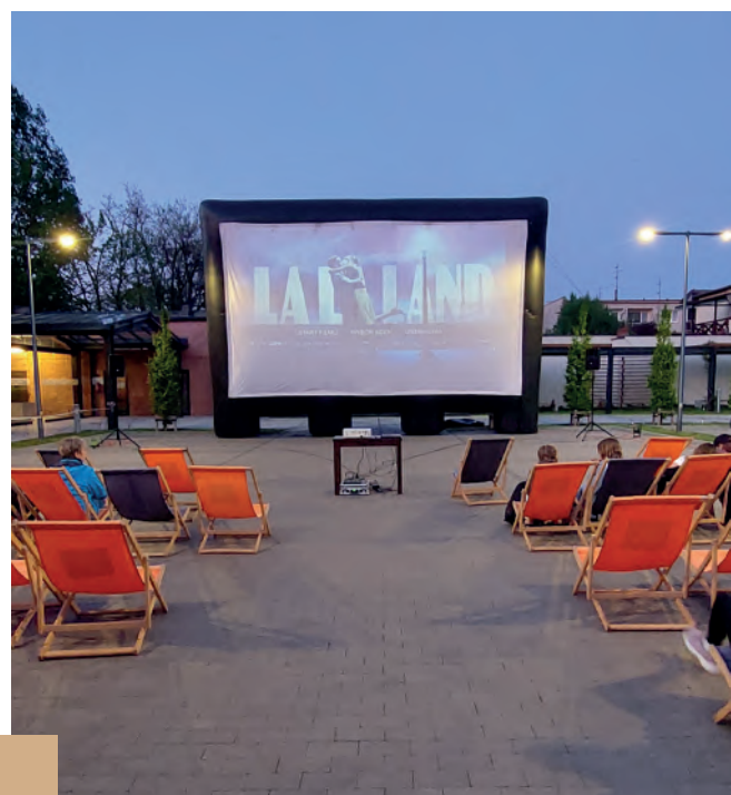
Fot. Centrum Kultury Czempień